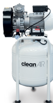
CLR 15/50 CLR 20/50 CLR 25/50