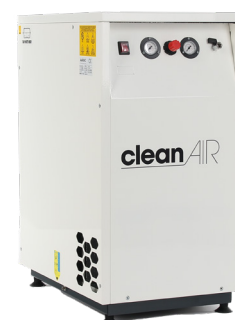
CLR 15/30 CLR 20/30