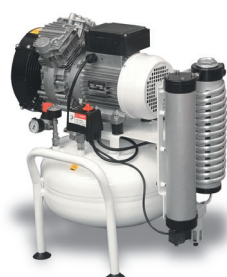
CLR 15/25 CLR 20/25